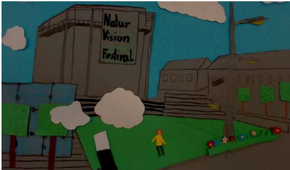
„Trickfilm: Grün in der Stadt“

Ihr Ralph Thoms und das NaturVision-Team