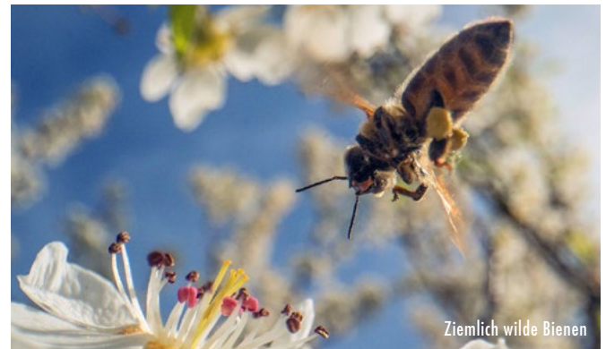
Ziemlich wilde Bienen

Wasser ist Leben. Mangel macht erfinderisch. Die Tierwelt Südmarokkos hat ihre ganz eigenen Antworten gefunden. Es gibt Sparsame, Vorratshalter, Trickreiche und Nahrungsspezialisten. Und manchmal kommt das Wasser. Dann verändert sich alles.