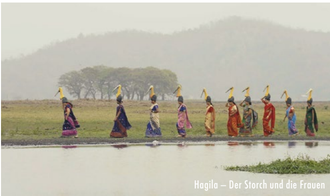
Hagila – Der Storch und die Frauen