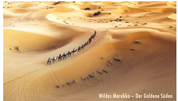
Wildes Marokko – Der Goldene Süden

Spechte sind die größten Baumeister in der Vogelwelt. Sie hämmern mehr Höhlen, als sie selbst brauchen. Zum Nutzen von Meise, Taube und anderen Höhlenbewohnern. Bei der Wohnortwahl sind Buntspechte offen für Neues. Spechtlöcher in gedämmten Hausfassaden sorgen für Unmut bei Hausbesitzern und Streit unter tierischen Hausbesetzern: Ist das Zimmer noch frei?