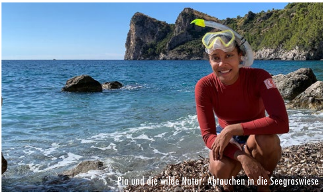
Pia und die wilde Natur: Abtauchen in die Seegraswiese