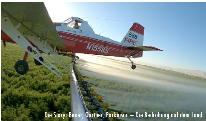
Die Story: Bauer, Gärtner, Parkinson – Die Bedrohung auf dem Land

Oktober 2019 wurde der Dannenröder Wald in Hessen von Klimaaktivistinnen und -aktivisten besetzt, um ihn vor der Rodung für eine neue Autobahntrasse zu beschützen. Mit Kreativität, Mut und Musik leisteten die Besetzerinnen und Besetzer Widerstand und zivilen Ungehorsam, bis am 8. Dezember 2020 dann doch der letzte Baum mit dem letzten Baumhaus fiel. Der Film begleitet die Aktivistinnen und Aktivisten von September 2020 bis Januar 2021.