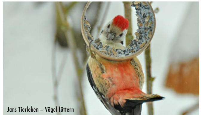
Jans Tierleben – Vögel füttern

Die Dokumentation enthüllt mit Hilfe modernster Kameratechnik einen geheimnisvollen Kosmos voller Drama und Schönheit jenseits unserer Wahrnehmung. Extreme Zeitlupenaufnahmen zeigen rasanten Tierverhalten in bis zu 40-facher Verlangsamung: Etwa, wenn sich ein Eisvogel nach erfolgreichem Tauchstoß in Superzeitlupe aus dem Wasser erhebt.