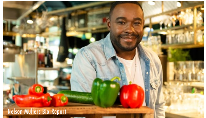
Nelson Müllers Bio-Report

Jonathan und Sarah begeben sich auf eine Reise, um Menschen zu treffen, die Alternativen zur gängigen Modeindustrie suchen. Ihr Weg führt sie von Deutschland bis nach Indien, vom Einzelhandel bis zum Baumwollbauern. Überall begegnen sie Heldinnen und Helden, die ihre Geschichten erzählen und persönliche Einblicke geben, warum sie beschlossen haben, andere Wege zu gehen.